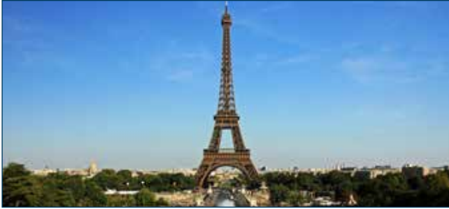
RPM Belgium appliceerde vloeren in de Eiffeltoren.