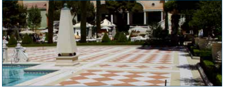
RPM Belgium appliceerde verschillende zwembadvloeren in Las Vegas.